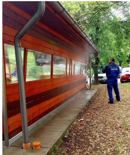
Harrer Ferenc utcai buszmegálló megtisztítása