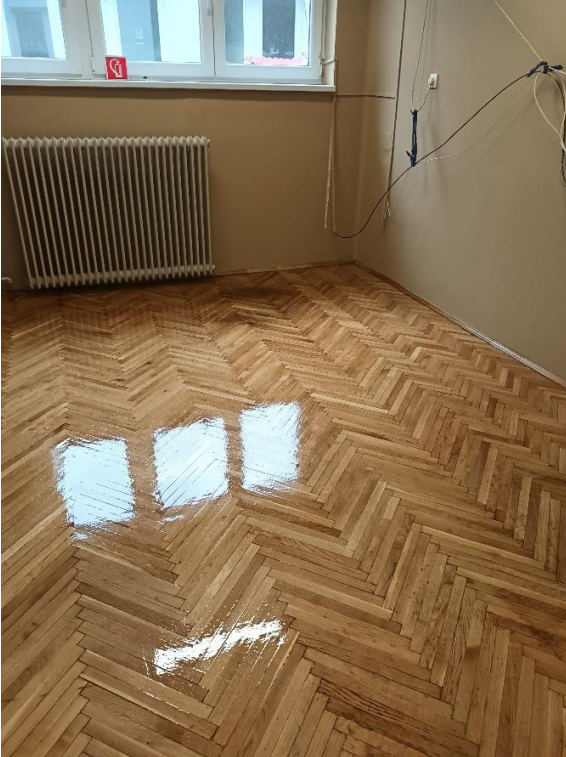
célgépekkel parkettacsizolást és felújítás