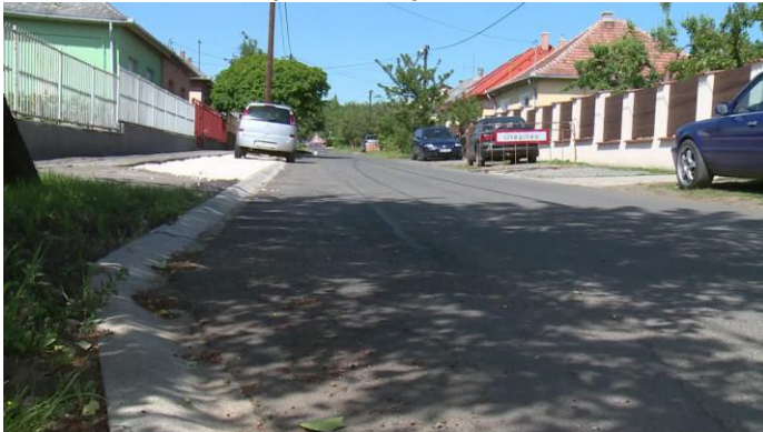
Berze Nagy János utca szélesítése