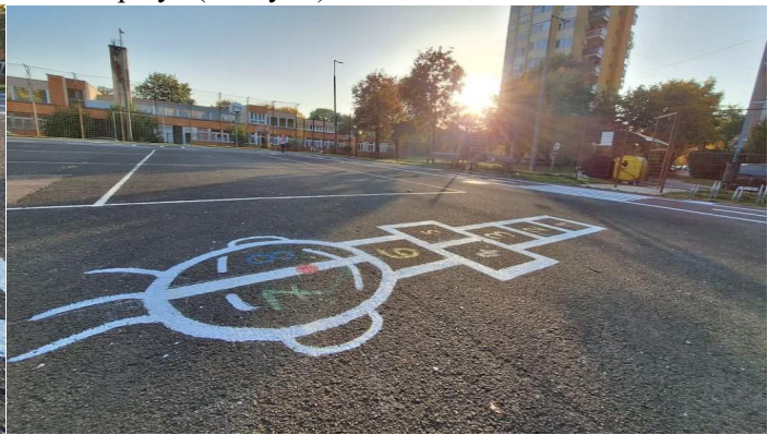
KRESZ pálya (Orczy út) felfestés