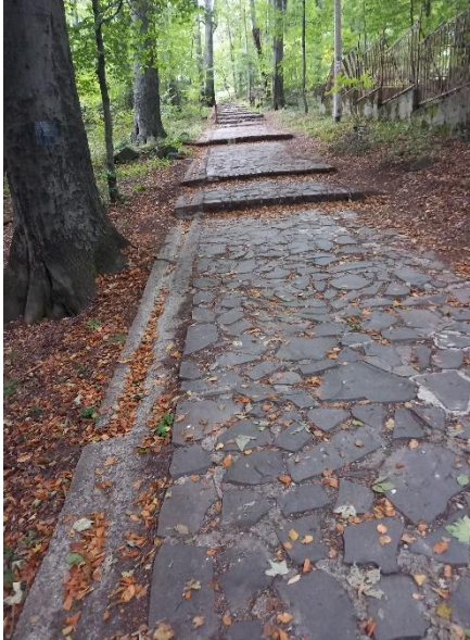
erdei sétány felújítása