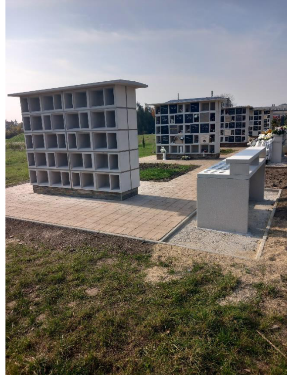
Urnafal alatti burkolatkészítés