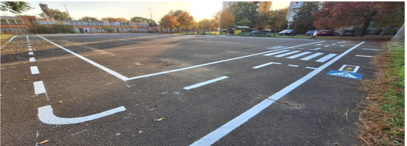
útburkolati jelek a KRESZ pályán