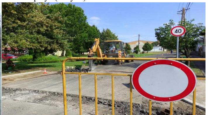
Radnóti utca és a Könyves Kálmán téri sarok gyalogátkelő