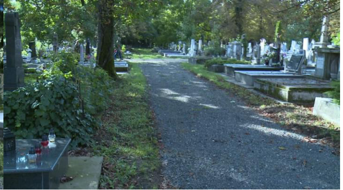
Alsóvárosi temető útjainak felújítása