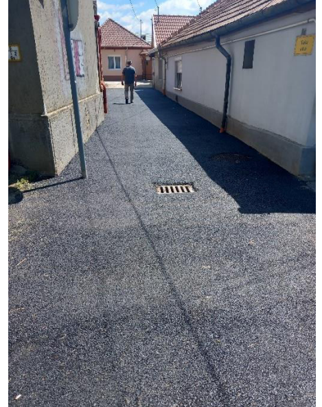
teljes útszakasz felújítás