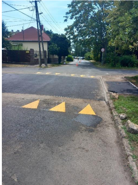
„fekvő rendőr” kialakítása, festése