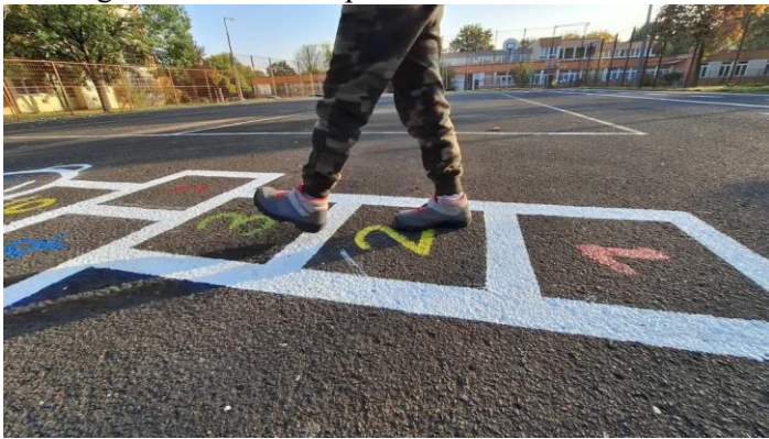
KRESZ pálya (Orczy út) felfestés