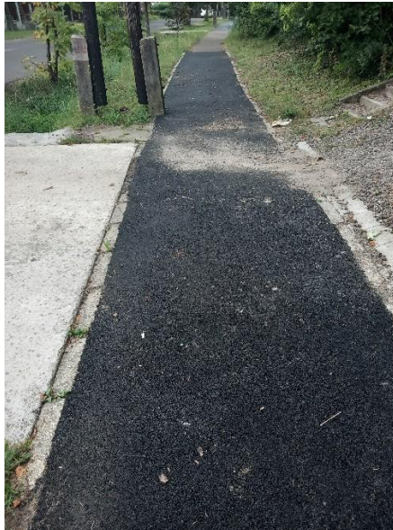
Mátrafüredi járda felújítás