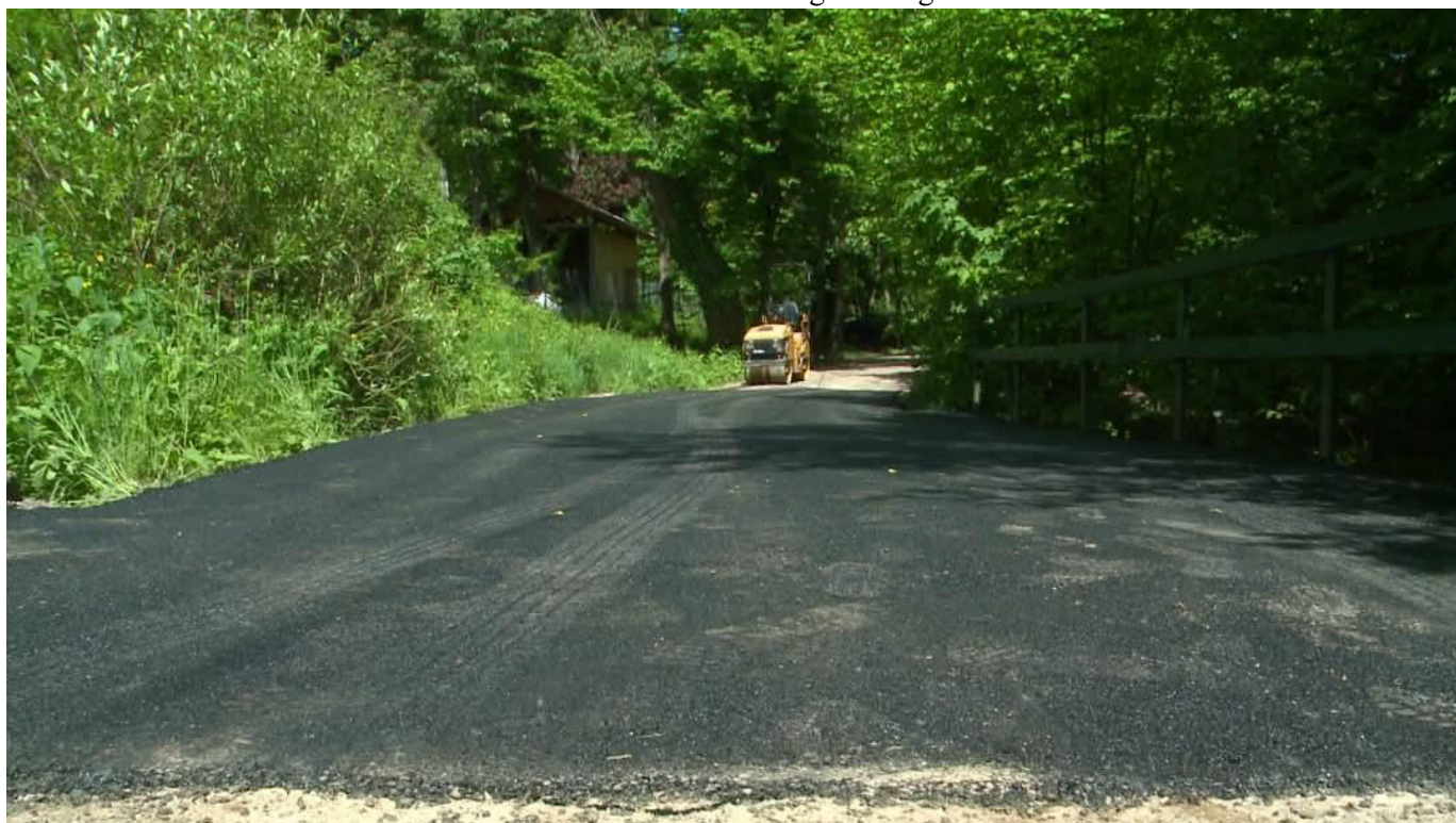
Mátrafüred, Parádi út felújítása