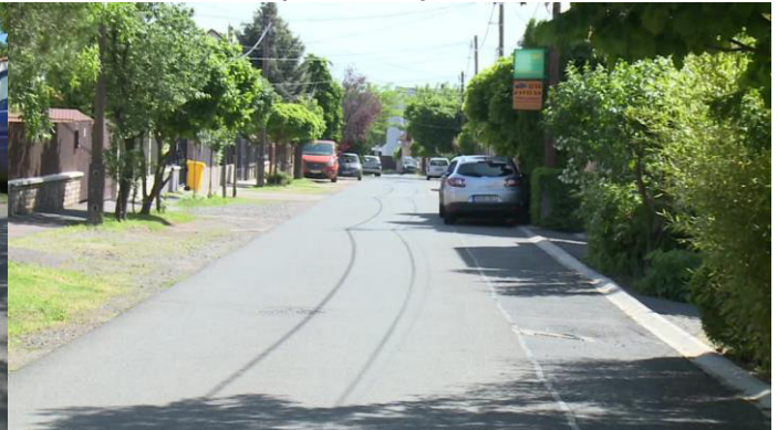
Berze Nagy János utca szélesítése