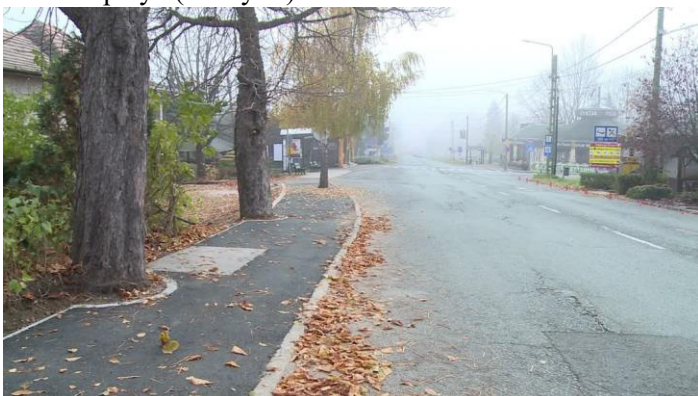
Mátrafüred, Parádi út járda felújítás