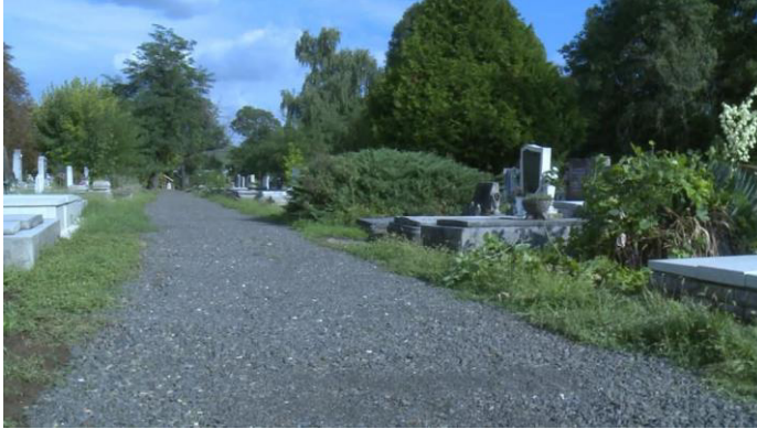
Alsóvárosi temető útjainak felújítása

ÉPÍTŐIPARI ÁGAZAT | HTTPS://VGRT.HU/EPITOIPAR/