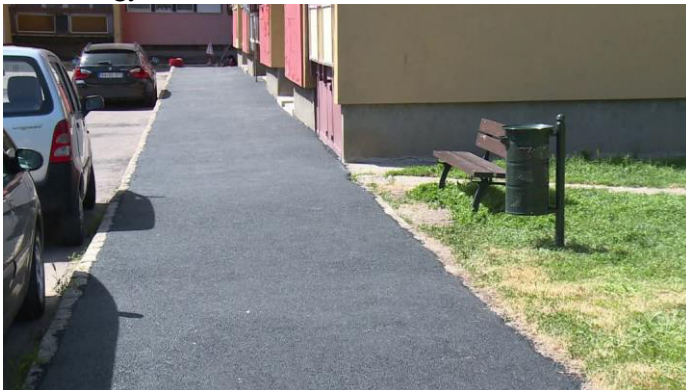
Pesti út 21-29 előtti járdajavítás