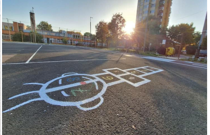
KRESZ pálya (Orczy út) felfestés